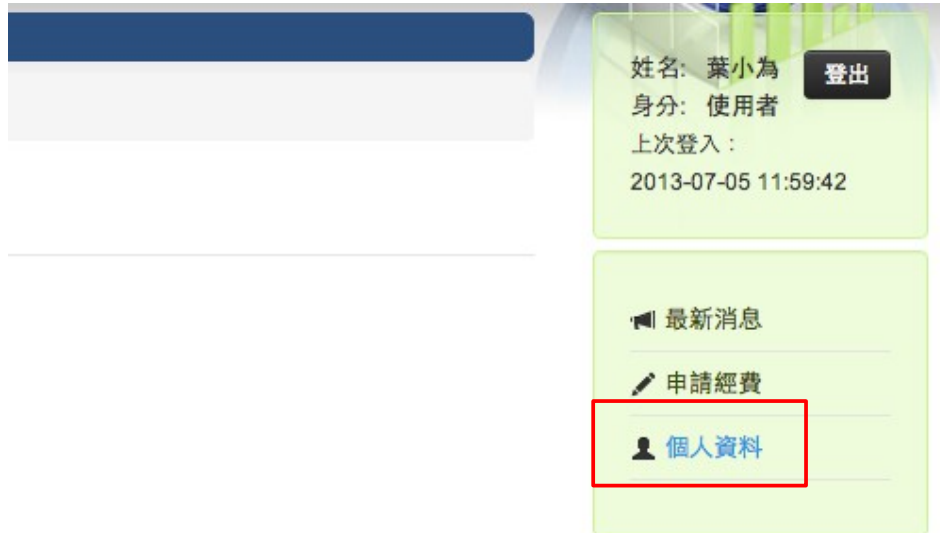
插圖 4: 在側邊選單點擊「個人資料」進入「個人資料」編修頁面