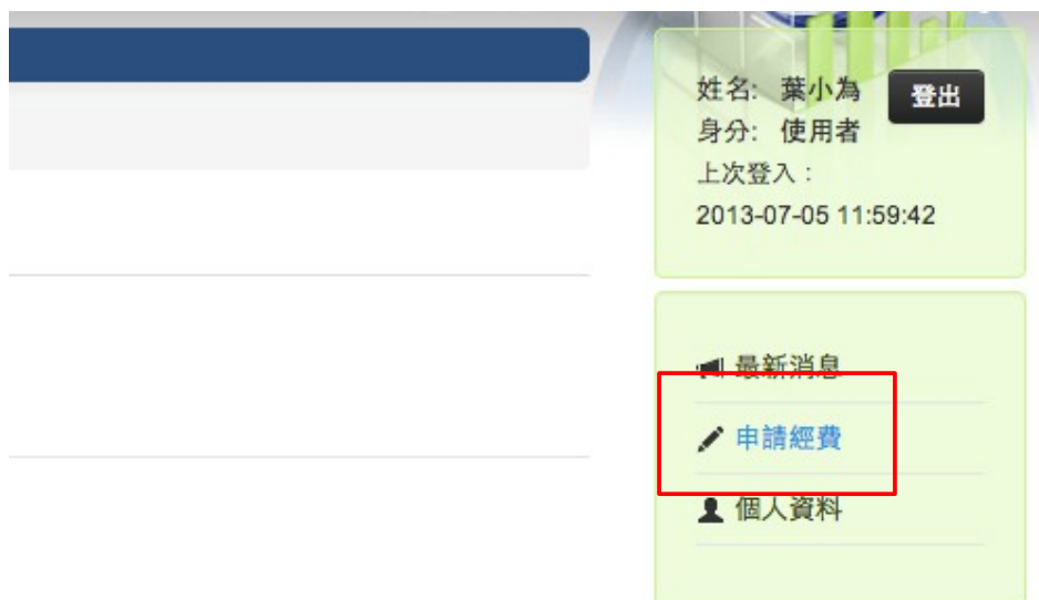
插圖 13: 在側邊選單點擊「申請經費」進入申請經費頁面