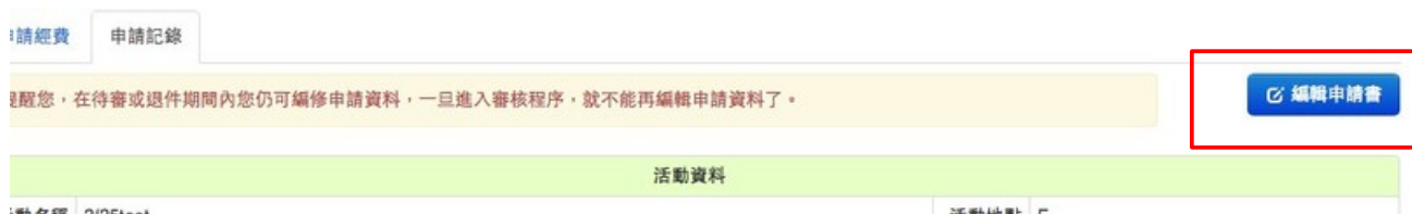
插圖 18: 在申請書詳情頁點擊「編輯申請書」按鈕