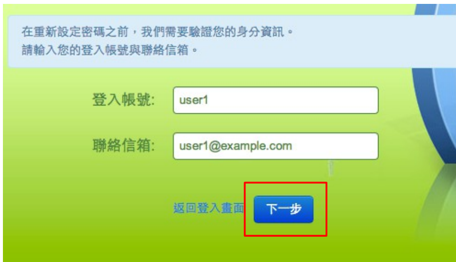
插圖 2: 輸入「帳號」及「信箱」後點「下一步」進入設定密碼畫面

輸入「新的密碼」並在「確認密碼」輸入框中輸入剛剛所填寫的新密碼，點下「重設密碼」以套用新的密碼設定。