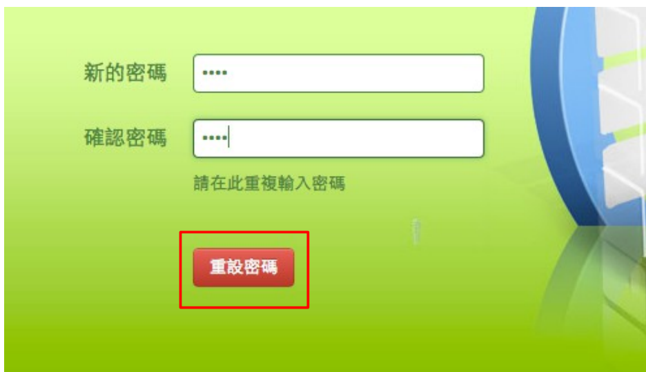
插圖 3: 輸入並確認新密碼後，點下「重設密碼」

輸入「新的密碼」並在「確認密碼」輸入框中輸入剛剛所填寫的新密碼，點下「重設密碼」以套用新的密碼設定。