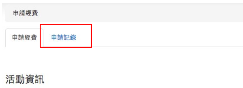
插圖 14: 點擊「申請記錄」頁籤以瀏覽申請記錄